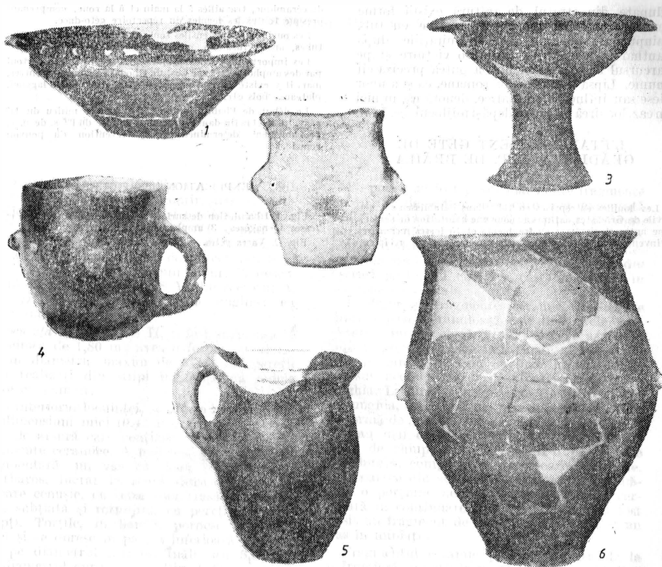
Fig. 2. Vase getice.

forme: cupe, fructiere, strecurători și chiu-puri, fiind ornamentate cu linii lustruite, canceluri sau linii incizate orizontale sau în val.